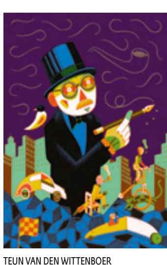
TEUN VAN DEN WITTENBOER